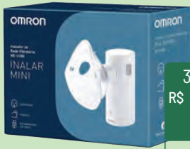
Inalador Omron Inalar Mini NE-U300

3x s/ juros de R$ 86,60 ou R$ 259,80 À VISTA