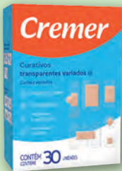
Curativo Cremer Variados com 6 Formas Transparents com 30un