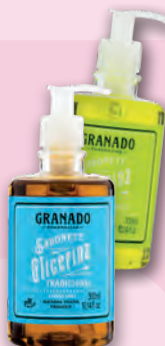
Sabonete Líquido Granado Glicerina Tradicional OU Extrato Natural 300ml