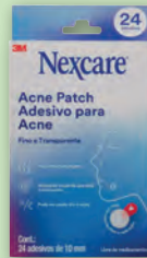
Adesivo Para Acne Nexcare 10mm com 24un