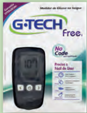
Kit G-Tech Medidor de Glicose Free

2x s/ juros de R$ 49,95 ou R$ 99,90 À VISTA