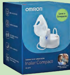
Inalador Nebulizador Omron Inalar Compact C-810

3x s/ juros de R$ 86,60 ou R$ 259,80 À VISTA