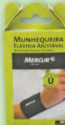
Munhequeira Elástica Ajustável Mercur com Tala Preta 1 Par