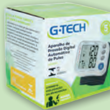
Aparelho de Pressão de Pulso Digital G-Tech GP400

3x s/ juros de R$ 66,60 ou R$ 199,80 À VISTA