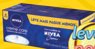
Kit Sabonete Nivea 90g Embalagem com 6un