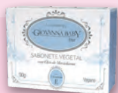
Sabonete Giovanna Baby Fragrâncias 90g