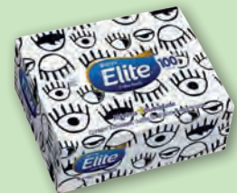
Lenço de Papel Softy Elite com 100un