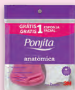
Espanja de Banho Facial Anatomica Ponjita