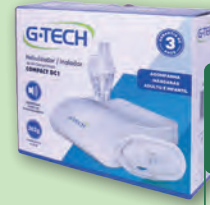
Inalador Nebulizador G-Tech Compact DC1

3x s/ juros de R$ 53,30 ou R$ 159,90 À VISTA