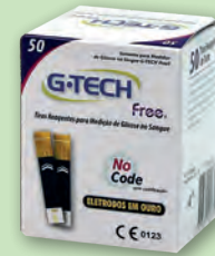
Tiras Para Controle de Glicemia G-Tech Free com 50un

2x s/ juros de R$ 57,95 ou R$ 115,90 À VISTA