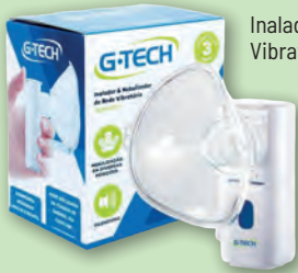
Inalador Nebulizador de Rede Vibratória G-Tech NEBMESH2

2x s/ juros de R$ 68,45 ou R$ 136,90 À VISTA