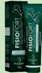
Pomada Massageadora Bio Instinto Fisiofort Original 150g