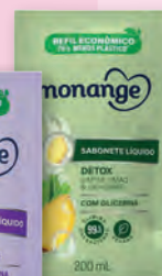
Sabonete Líquido Refil Monange Fragrâncias 200ml